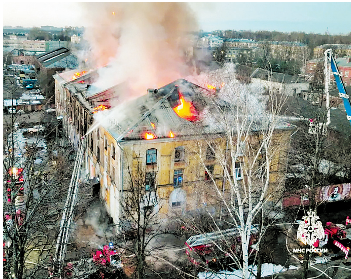
Пожар в доме №61 по улице Стачек тушили в течение трех дней.

« В результате крупного пожара, по данным регионального минздрава, пострадала одна жительница дома. Ее госпитализировали в больницу им. Соловьева в тяжелом состоянии. Женщина находится под постоянным контролем врачей. »