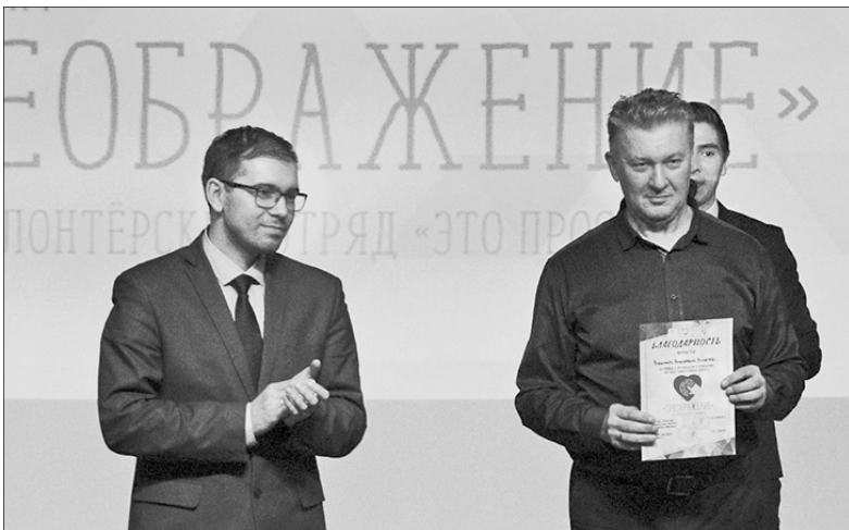
На выставке «Преображение».