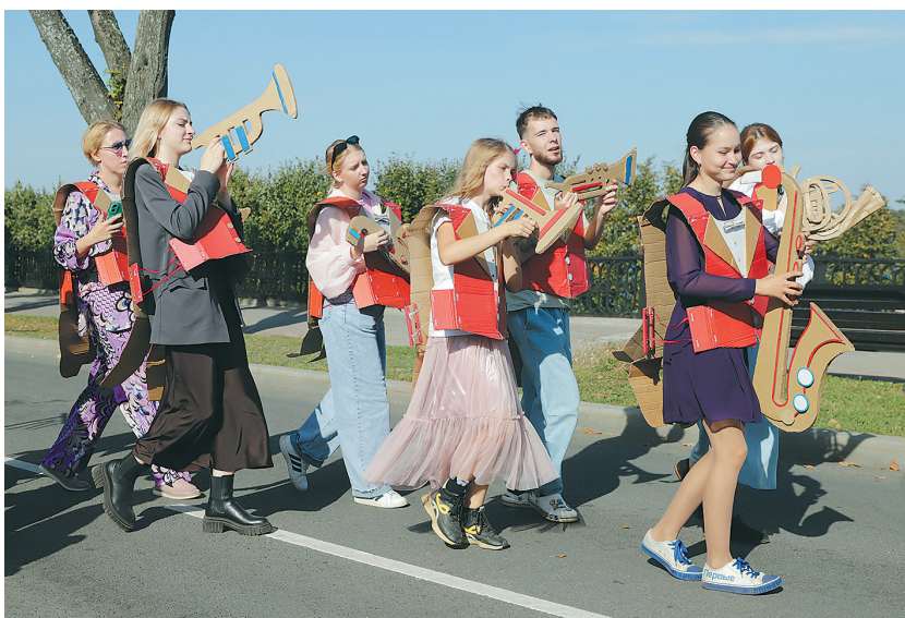
↓ Фестиваль «Волков. Подмостки»: оркестр «Картония» на Волжской набережной.