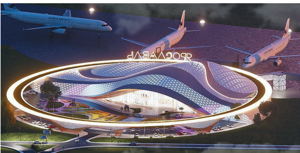
↓ Весной следующего года планируется начать строительство пассажирского терминала аэропорта Ярославль.