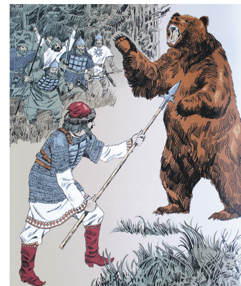
Иллюстрация к главе «Ярославский герб».

– Мне кажется, эта книга должна приглашать читателя пройтись по городу, увидеть то, что раньше не замечали, – говорит Владимир Жельвис. – Еще раз посмотреть на эти здания, улицы и, кстати, на нас, ярославцев, потому что мы тоже часть этого города. ■