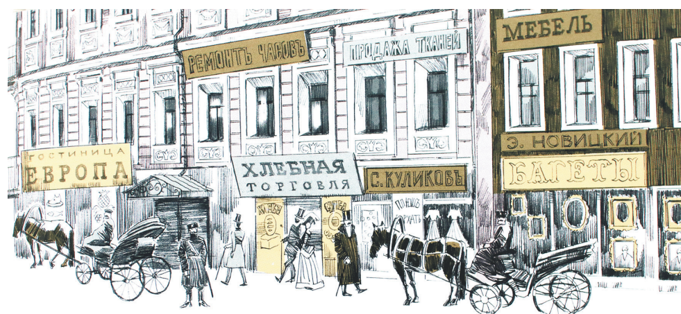
Иллюстрация к главе «Трамвай в Ярославле».

– Мне кажется, эта книга должна приглашать читателя пройтись по городу, увидеть то, что раньше не замечали, – говорит Владимир Жельвис. – Еще раз посмотреть на эти здания, улицы и, кстати, на нас, ярославцев, потому что мы тоже часть этого города. ■