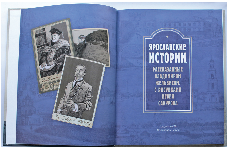
Книга «Ярославские истории».