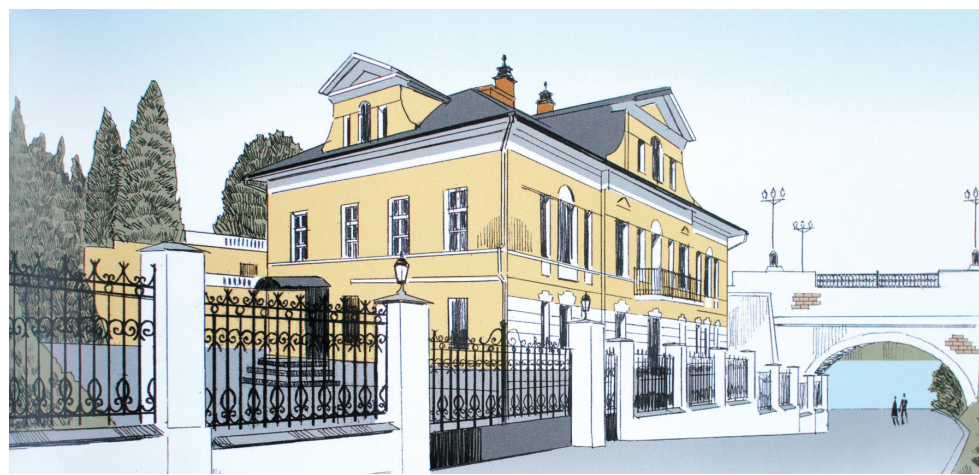
Дом Болконского. Красивая легенда.