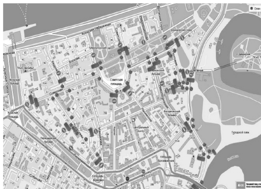
Схема расстановки временных дорожных знаков для ограничения (прекращения) движения транспортных средств 04.11.2023

Приложение к приказу директора департамента городского хозяйства от 30.10.2023 № 186