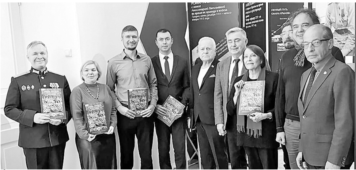
На презентации шестого выпуска альманаха в Ярославском музее-заповеднике.