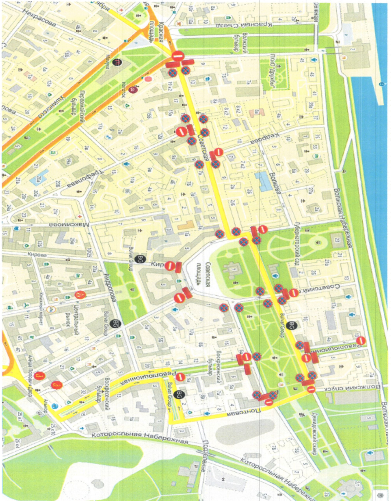
Схема расстановки временных дорожных знаков для ограничения (прекращения) движения транспортных средств с 15.00 часов до 22.00 часов 04.05.2026, 05.05.2026, 07.05.2026