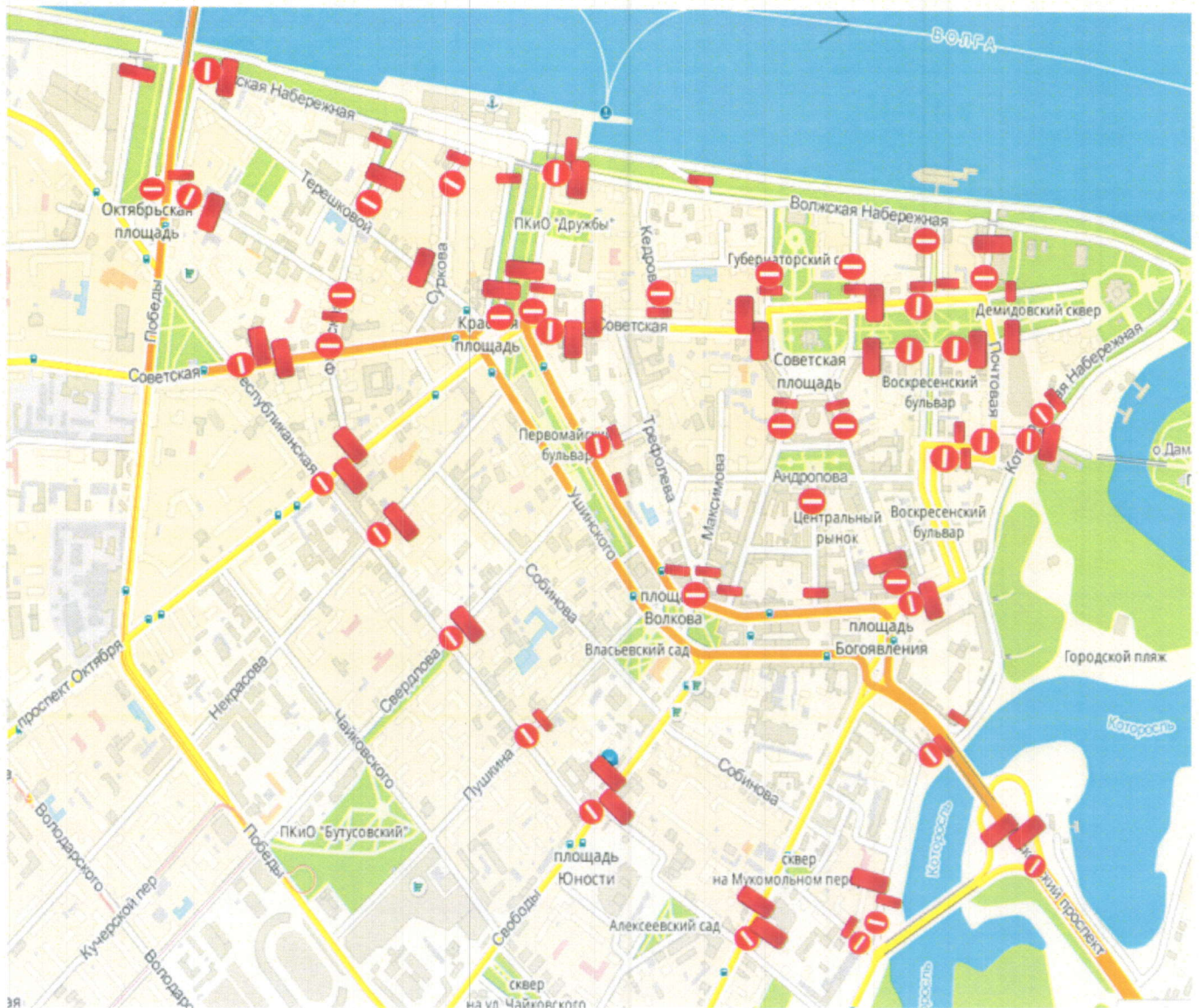
Схема расстановки временных дорожных знаков для ограничения (прекращения) движения транспортных средств 30.05.2026

Приложение 2 к приказу директора департамента городского хозяйства от 20.05.2026 № 62