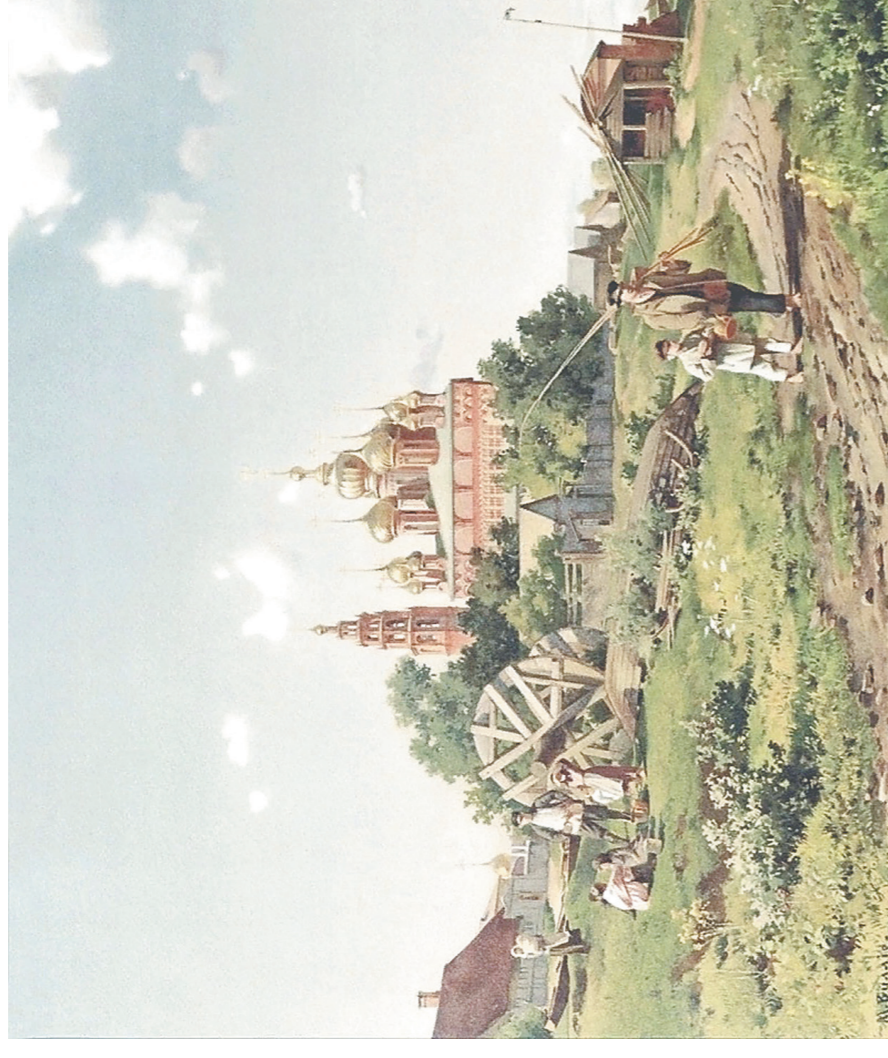
Михаил Виллие. «Вид церкви Иоанна Предтечи», 1880-е.