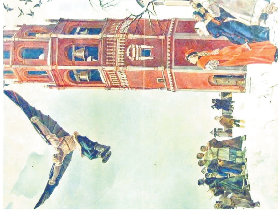
Александр Дейнека. «Икнистка – первый русский летун», 1940 г.

Приоритетный объект По решению губернатора Ярославской области Михаила Евраева, церковь Иоанна Предтечи планируется