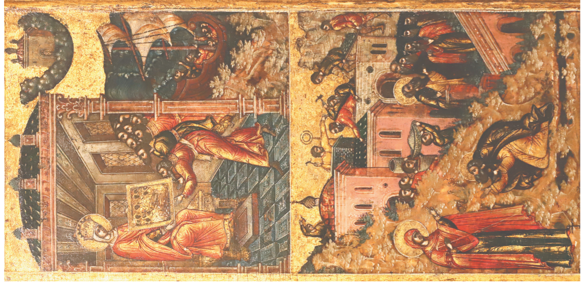
Уникальные миниатюрные иконы XIX века на иконе «Богоматерь на престоле», написанной в XVII веке.

Храм Иоанна Предтечи не изменялся на протяжении веков, не перестраивался. Исключение – центральная глава: изначальная церковь венчала опромная «луковица». В XVIII веке церковь сильно пострадала от пожара, и новую главу решили сделать более вычурной, в стиле барокко. Она прекрасно вписалась в облик храма. На внешних стенах храма можно увидеть все ступени украшения фасадов, известные в XVII столетии. Здесь и лексальный кирпич, и прекрасные полихромные изразцы, и золоченые подзоры, и имитация граненого камня – так называемая роспись под бриллиантовый