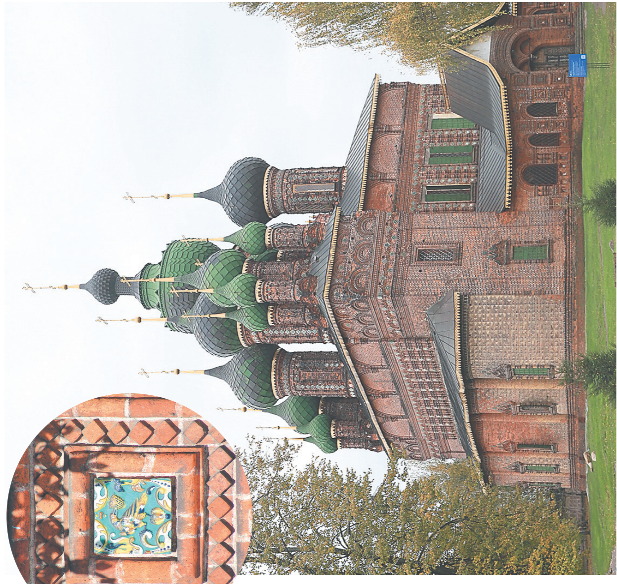
Церковь Иоанна Предтечи.

Что объединяет русского баталиста Василия Верещагина, советского живописца Александра Дейнеку и российского художника Игоря Крылкова кроме места проживания и любви к изобразительному искусству? Каждый из них в свое время изобразил в своих произведениях жемчужину ярославской архитектуры – уникальный храм – церковь Иоанна Предтечи.