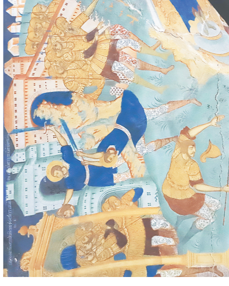
Фрески церкви Иоанна Предтечи.

включить в перечень приоритетных объектов для реставрации в Ярославском регионе. Дорожная карта по реставрации уникального храма уже разработана. На все требуется не много ни мало – два с лишним миллиарда рублей.