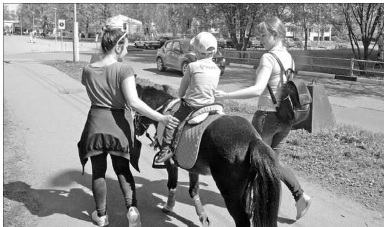
И пони тоже кони.

Лошадь — животное маленькое и не вполне предсказуемое. Если она начинает вести себя неадекватно в специально отведенном месте, опасности подвергаются только ее поводырь и наездник. А вот если у этого животного вдруг отказывает «контрольный центр» на оживленной площади или на улице, масштабы бедствия могут быть воистину массовыми. Именно поэтому под услуги катания на лошадях и выделяют территории, где лошади и люди могут разминуться. Это четыре парка — «Нефтяник», «Юбилейный», Победы и фабрики «Красный перевал», а еще место отдыха под народным названием «Карпаты» в Тверицком бору.