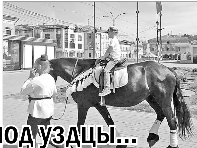
Большой конь представляет опасность для поездки.

Ко всему прочему услугу катания на лошадях довольно часто оказывают малолетние граждане, которые по действующему