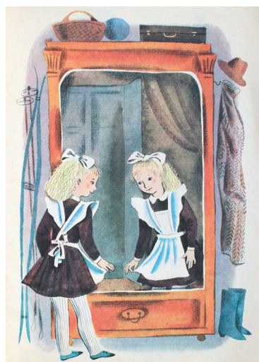
Агния Барто в рисунках Ксении Почтенной.