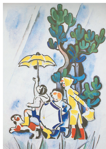
Агния Барто в рисунках Наума Цейтлина.