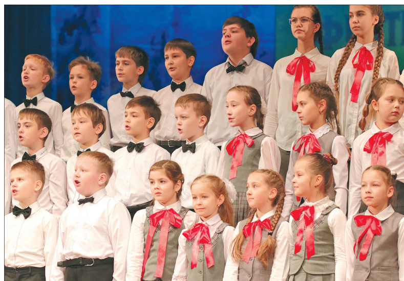
Хоровой коллектив школы № 49.