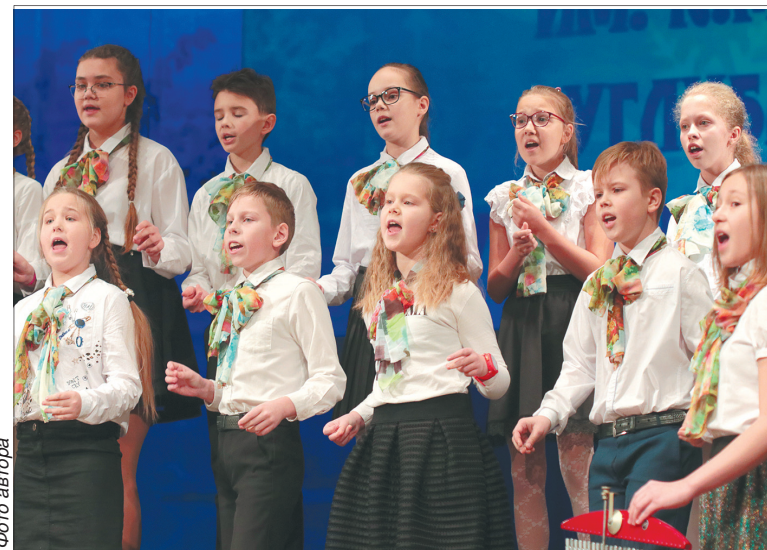
Хор «Весна» школы № 33.