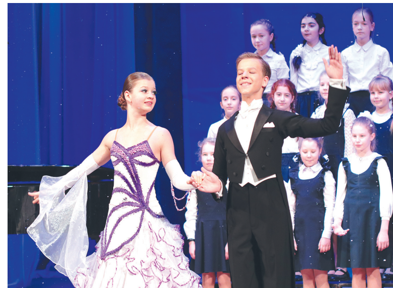
Танцевальный подарок гостям и участникам фестиваля.