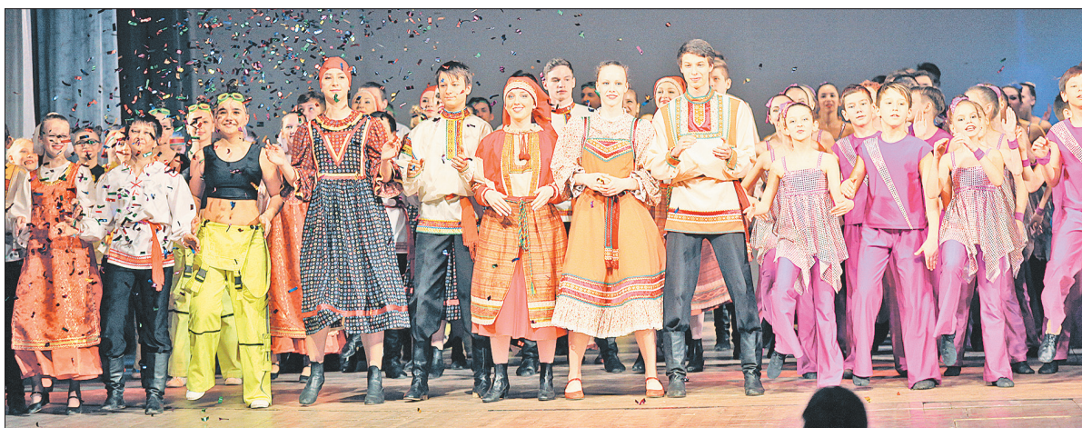
Общий выход участников концерта.