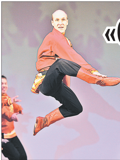
Подарок от «Волжанки».

Зрителям представили 26 из 200 имеющихся «в архиве» коллектива номеров. Восстановлены танцы из золотого фонда: «Венгерский», «Словацкий», «Кадриль с выкрутасами». На старый «Матросский танец» на сцену вышли 48 парней! Из 200 учеников «Счастливого детства» почти половина – мальчишки.