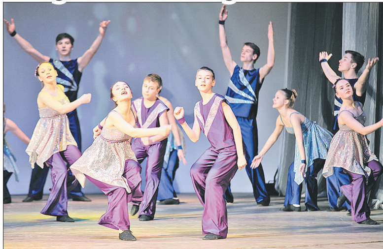
Танец «Счастливое детство» в исполнении юбиляра.

Среди выпускников «Счастливого детства» – танцоры российских государственных ансамблей. Заслуженный артист России Иван Заломаяев – солист Го-