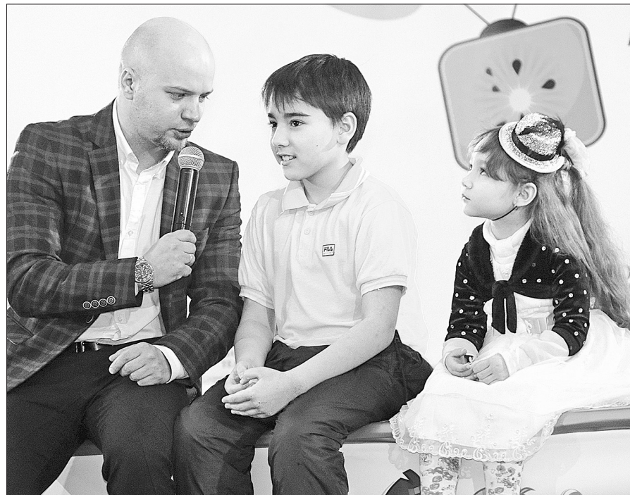
Ведущий с юными артистами.